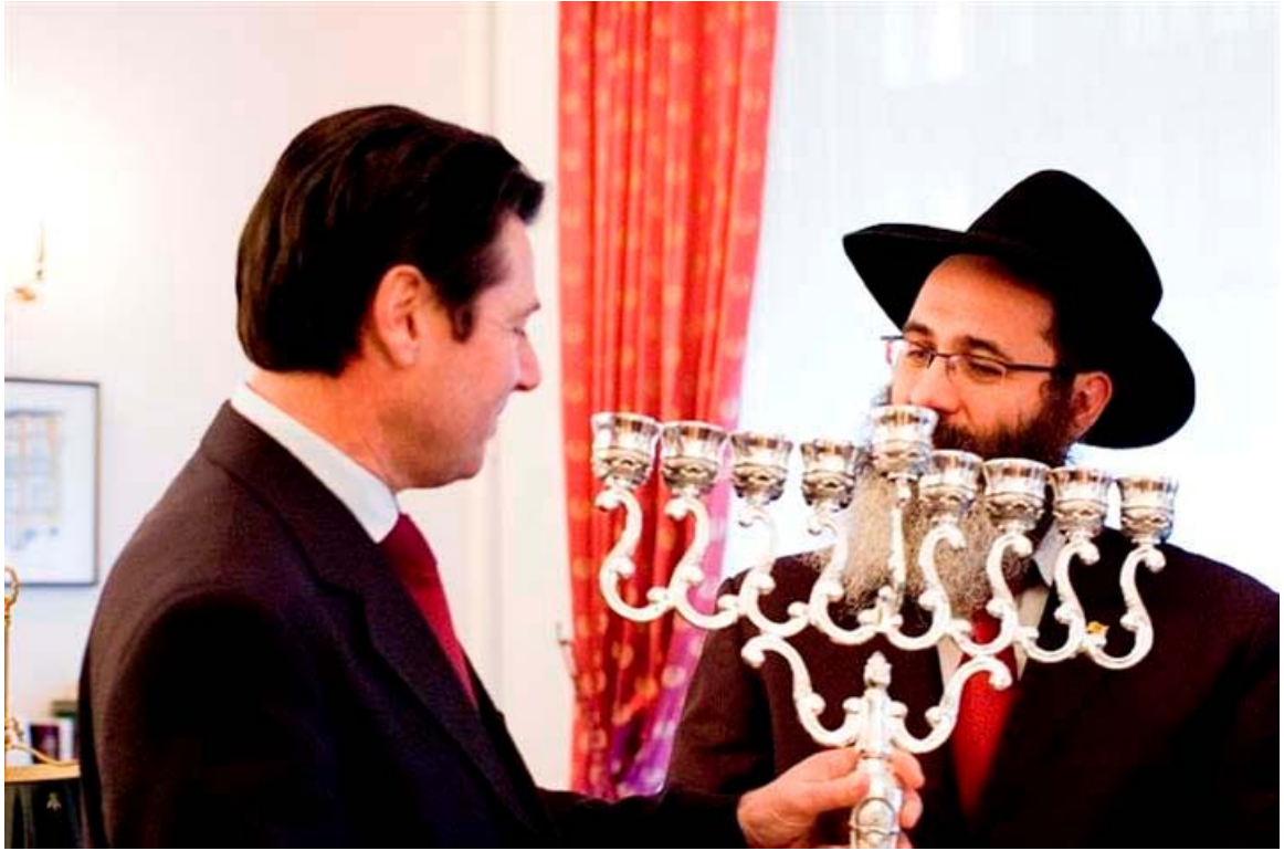
Christian Estrosi recevant une Menorah de la part des Lubavitchs.