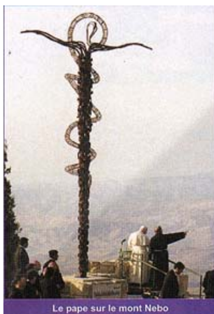
Le Pape Jean-Paul II sur le mont Nebo