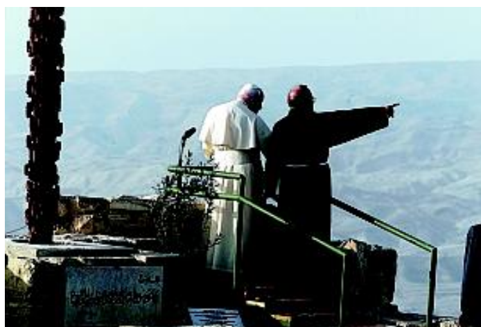
Que faisait le pape Jean-Paul II au Mont Nebo ?

Voici la photo que la plupart des médias vous ont montrée :