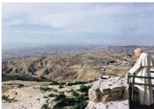
La vue que Moïse et Jean-Paul II avait sur la terre promise